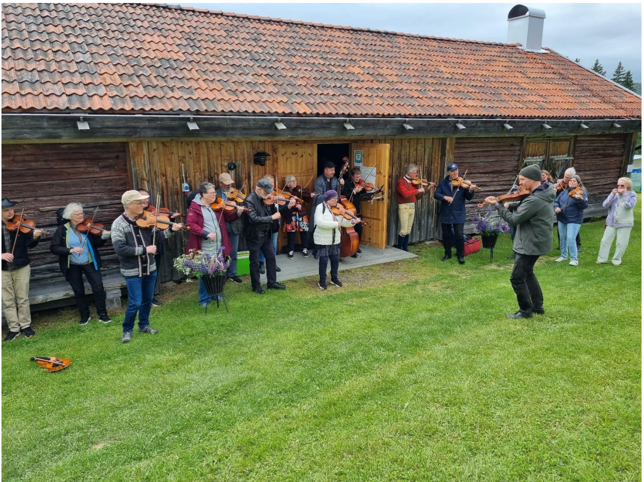
Jämtstämman i Klövsjö 2025