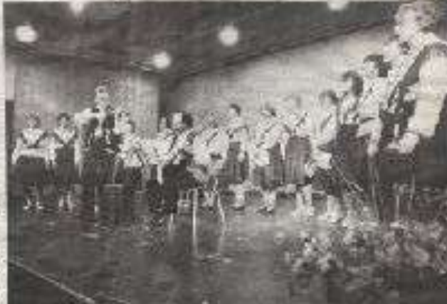
Folkets Hus i Jämtland. En kväll av jämtländsk musik och dans på Folkets Hus i Jämtland. En kväll av musik och dans som är en del av den stora kulturfestivalen som pågår i Jämtland under sommarmånaderna.

En kväll av jämtländsk musik och dans på Folkets Hus i Jämtland. En kväll av musik och dans som är en del av den stora kulturfestivalen som pågår i Jämtland under sommarmånaderna.