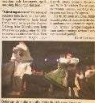
Folkets Hus i Jämtland. En kväll av jämtländsk musik och dans på Folkets Hus i Jämtland. En kväll av musik och dans som är en del av den stora kulturfestivalen som pågår i Jämtland under sommarmånaderna.

En kväll av jämtländsk musik och dans på Folkets Hus i Jämtland. En kväll av musik och dans som är en del av den stora kulturfestivalen som pågår i Jämtland under sommarmånaderna.