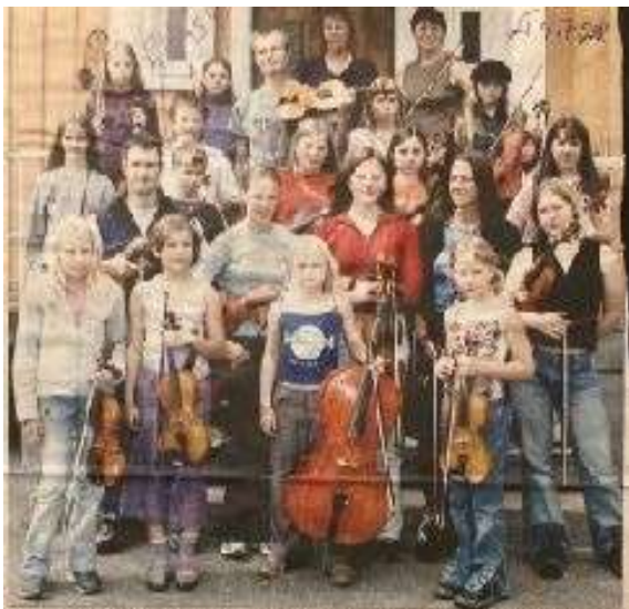
Fotograf av Anders Johansson. Bilderna är publicerade i samarbete med Vemdalens Tidning. Bilderna är publicerade i samarbete med Vemdalens Tidning.

I samband med Riksspelmansstämman i Vemdalen 2002 kunde man konstatera ett trendskifte ikönsfördelningen bland deltagarna i ungdomsläget. Och Gregoriekapleiken blev återigen en succé!