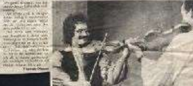
Folkets Hus i Jämtland. En kväll av jämtländsk musik och dans på Folkets Hus i Jämtland. En kväll av musik och dans som är en del av den stora kulturfestivalen som pågår i Jämtland under sommarmånaderna.

En kväll av jämtländsk musik och dans på Folkets Hus i Jämtland. En kväll av musik och dans som är en del av den stora kulturfestivalen som pågår i Jämtland under sommarmånaderna.