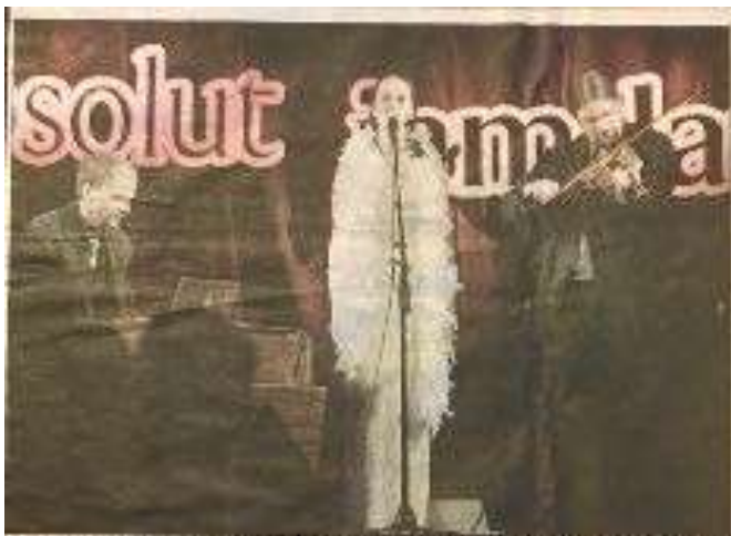
En kväll av jämtländsk musik och dans på Folkets Hus i Jämtland. En kväll av musik och dans som är en del av den stora kulturfestivalen som pågår i Jämtland under sommarmånaderna.